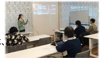
TAMAGO iPad 基礎講座

シニアのパソコン学習グループ「IT100」の皆さんの講座でも、今年度の講座についての感想を伺い、次年度に向けたお話をし、課題の Excel でも少し難しい Lesson に挑戦するなど、年度のまとめの回となりました。